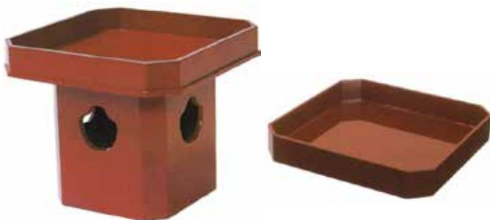
朱三宝・折敷 木製